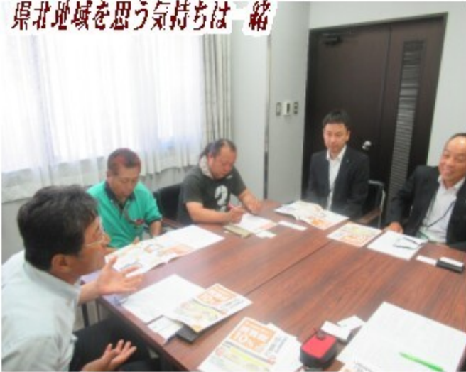
県北地域を思う気持ちは一緒

ニーズに合った迅速な資金供給については、「当然と捉えています。赤字であっても、事情をお聞きして、代表